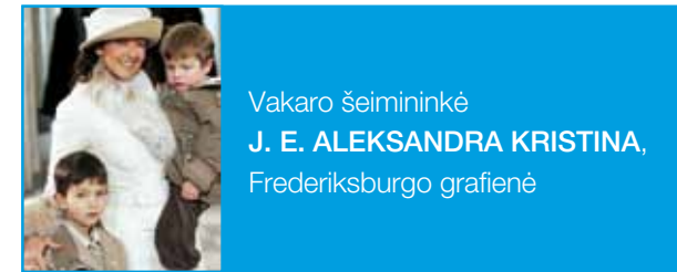
Vakaro šeimininkė J. E. ALEKSANDRA KRISTINA, Frederiksburgo grafienė

Skirtas sustabdyti vaikų ir motinų mirtingumą Kambodžoje