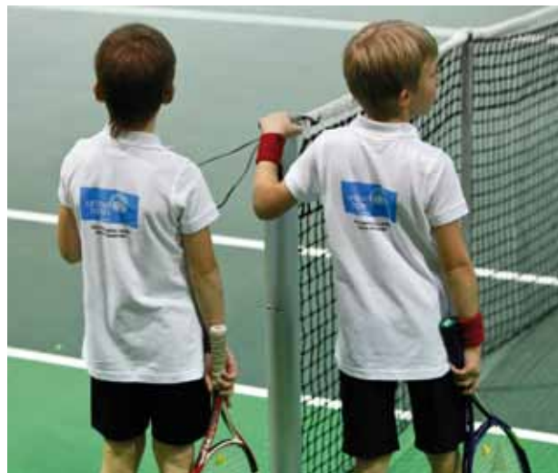
Lauko teniso turnyro dalyviai