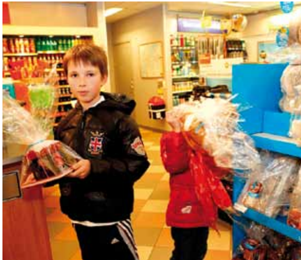
Vaikučiai nusprendė paremti UNICEF, nupirkdami dovanėlių.