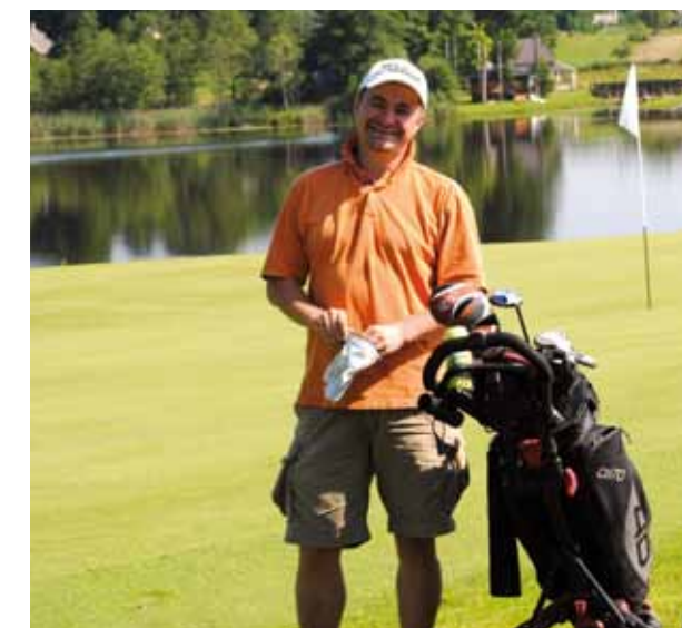
Puikią nuotaiką turnyre skleidė „Swedbank“ valdybos pirmininkas Antanas Danys