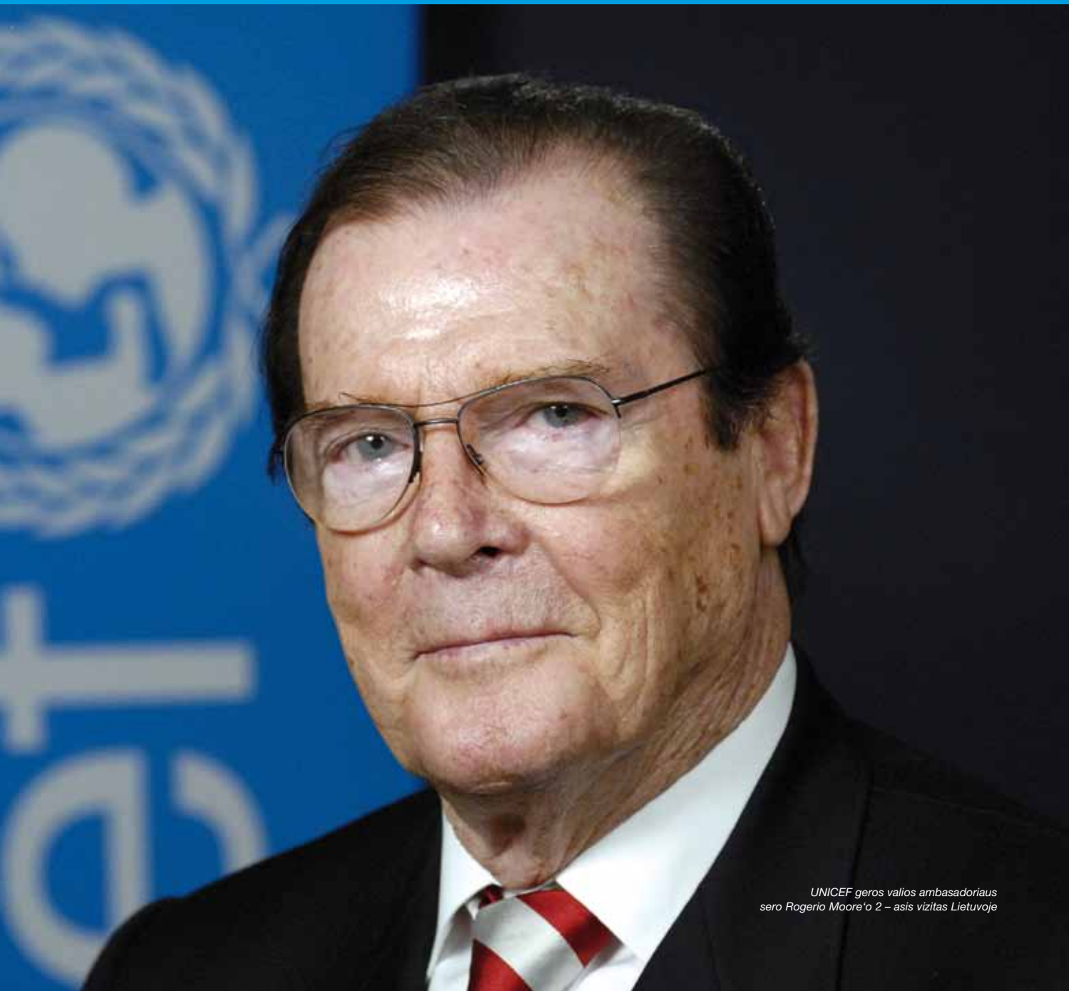
UNICEF geros valios ambasadoriaus sero Rogerio Moore'o 2 – asis vizitas Lietuvoje