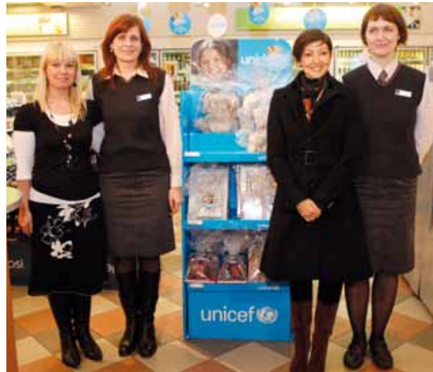
J. E. Frederiksburgo grafienė su Lietuva Statoil darbuotojais.