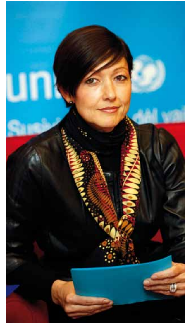
J.E. Aleksandra Kristina spaudos konferencijoje, Vilniuje

13.45 J. E. Aleksandra Kristina išvyksta į Kopenhagą.