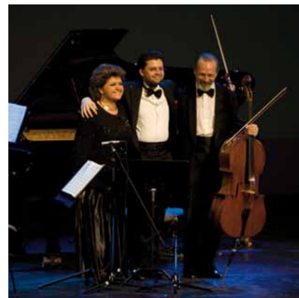
Julianas Rachlinas su mama ir tėčiu.

Julianas Rachlinas , 1988 m. Amsterdame „Concertgebouw“ vykusiame Eurovizijos konkurse laimėjęs „Metų jaunojo atlikėjo“ apdovanojimą, bematant išgarsėjo visame pasaulyje. Lorinas Maazelis jį pakvietė su Prancūzijos nacionaliniu orkestru debiutuoti Berlyno festivalyje ir su Pitsburgo simfoniniu orkestru gastroliuoti Europoje bei Japonijoje. Jis yra grojęs su garsiausiais pasaulio orkestrais ir dirigentais. 1999 m. J. Rachlinas tapo Vienos konservatorijos profesoriumi. Nuo 2000-ųjų jis kasmet rengia sparčiai pasaulyje garsėjantį savo festivalį „Julianas Rachlinas ir draugai“. Atlikėjo talentą jau ne kartą įvertino ir pamėgo Lietuvos publika.