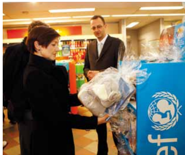
J. E. Aleksandra Kristina lankėsi Lietuva Statoil degalinėje šalia Parlamento.